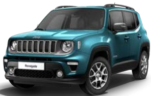
470 (opc. 61Q) 266 (opc. 0Q0) - črna streha