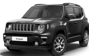
095 (opc. 5CC)