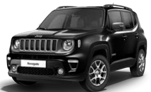
876 (opc. 5CE)