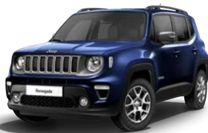
888 (opc. 5DP) 100 (opc. 6WS) - črna streha