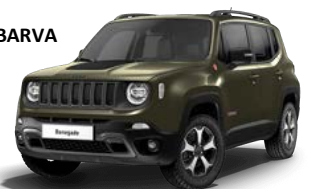
149 (opc. 5CL)