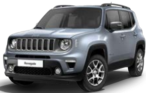
348 (opc. 5DN)