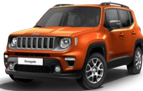
562 (opc. 5DL) 720 (opc. 5ZA) - črna streha