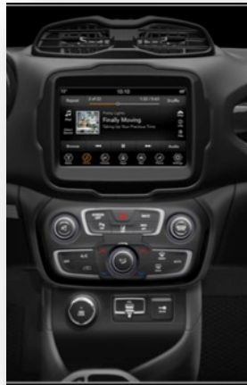
7-palčni HD zaslon