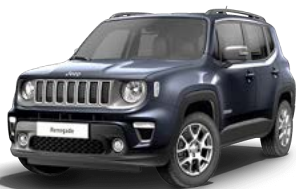
435 (opc. 61P) 263 (opc. 0PY) - črna streha