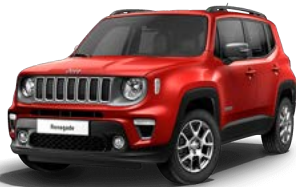
176 (opc. 5CJ)