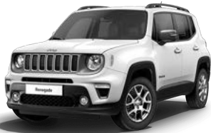
296 (opc. 5CA) 317 (opc. 6Y0) - črna streha