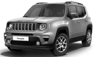
503 (opc. 8CZ) 264 (opc. 0PZ) - črna streha